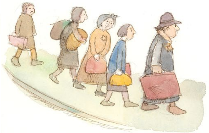
Ausstellungsbilder von Lukas Ruegenberg